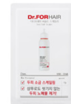
10 мл+10 мл арт. DF0068-9

Выпускается в виде ватных палочек, пропитанных лосьоном. Влажным концом ватной палочки провести несколько раз по поверхности сухой кожи. Не смывать. Использовать, как альтернативу сухим шампуням в качестве экспресс-очистки. В комплексной терапии себореи, перхоти и шелушения использовать индивидуальным курсом ежедневно. Можно использовать в комплексной терапии против выпадения, наносить после использования лосьона «Фоллиген» с пептидами меди. Не смывать.