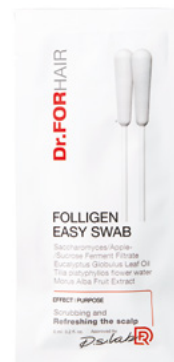
6 мл*10 шт арт. DF0071

Нанести капельно на чистую кожу головы и распределить по всей поверхности с помощью активного массажа. Не смывать. Для интенсивной терапии при диффузном и/или сезонном выпадении волос использовать после каждого мытья головы в течение 2-3 месяцев. Для интенсивной терапии выпадения волос по мужскому типу использовать ежедневно на постоянной основе. Для профилактики выпадения, а также для стимуляции роста волос использовать 1-2 раза в неделю курсами по 2-3 месяца.